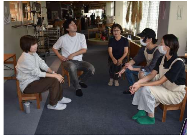
左から、かずこさん、ふじむらさん、ゆかりさん、みぞぶちさん、えみかさん