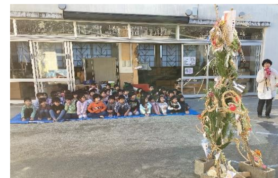
だんどうき みんなが元気にすごせましように！