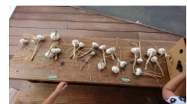
ののほな畑にんにく